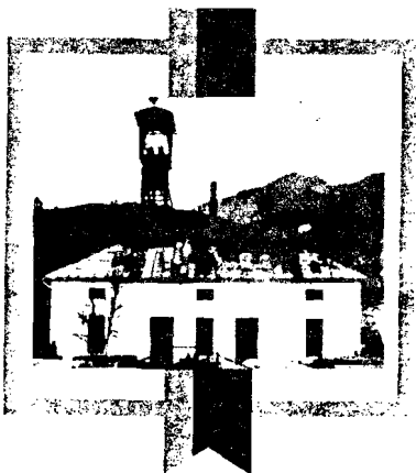
FD IDRİJA št.15