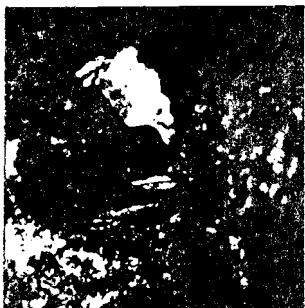
KRISTAL CINABARITA ID IDRIJA ŠT. 12

IDRIJSKI GRAD GEWERKENEGG STALNA MUZEJSKA RAZSTAVA »PET STOLETIJ RUDNIKA ŽIVEGA SREBRA IN MESTA IDRIJE«