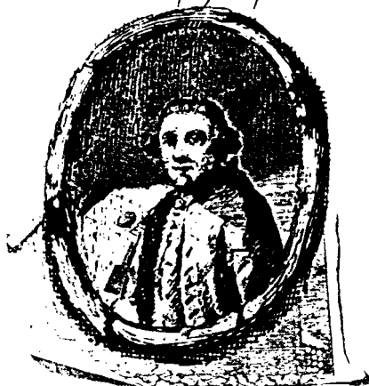
fd Idrija št. 10

Joseph Mrackh Marckscheider in Idria 1709 - 1786